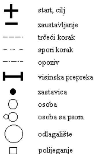
Slika 1. Staza za polaganje ispita za psa pratioca

Staza je označena s 8 zastavica i na njoj se nalaze jedna visinska prepreka (visine 40 cm za pse visine grebena iznad 40 cm, te 30cm za pse visine grebena do 40cm), dvojna vrata i označeni prostor za polijeganje pasa.